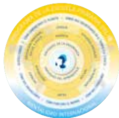
Figura 2: Modelo del PEP

Modelo pedagógico del PEP. Tomado de https://www.ibo.org/es/digital-toolkit/lo-gos-and-programme-models/